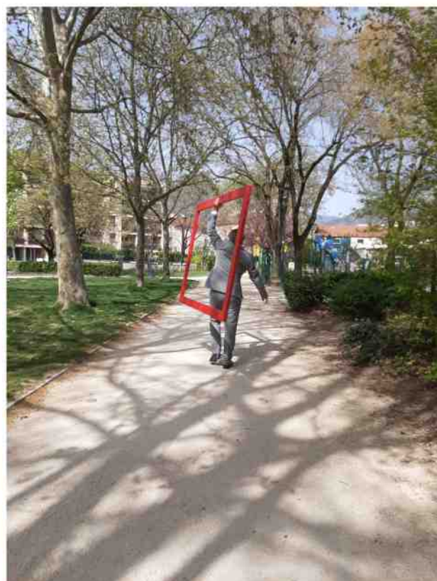
Résidence de création / MJC Parmentier - Grenoble