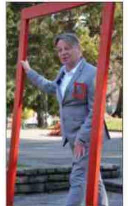
Le comédien Heiko Buchholz propose une approche déambulatoire philosophique, poétique et scientifique.

Une approche déambulatoire philosophique, poétique et scientifique de la vision du monde, à travers un