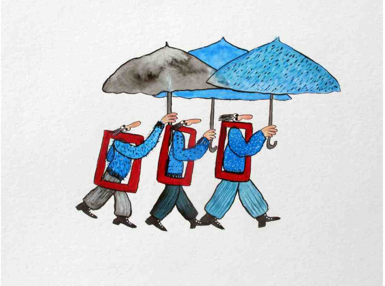
Résidence de création juin 2021 - La Maison de l'environnement du Malsaucy - Département du Territoire de Belfort