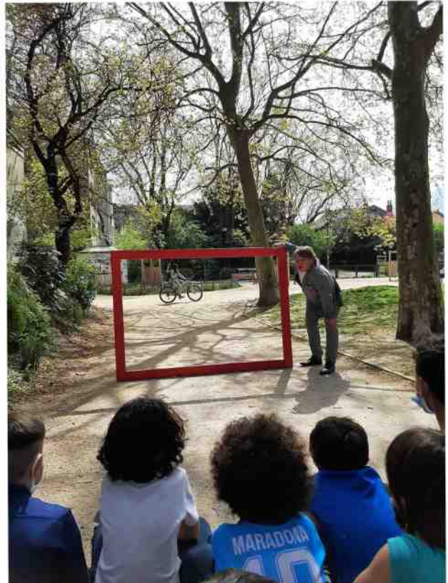
Résidence de création / MIC Parmentier - Grenoble - Photos Claudine Sallenave